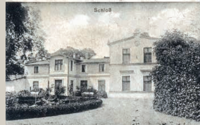
Sarbia na starej widokówce