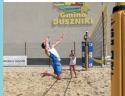
Beach volleyball Strandvolleyball