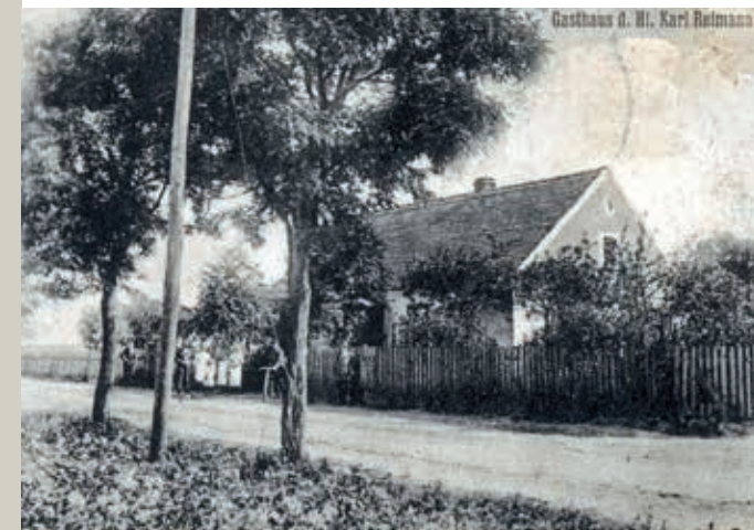
Sarbia bei Königshof

Mieściska i Sarbia stanowią jedno sołectwo. Początki Mieścisk sięgają przełomu XIV-XV w. Pierwsza wzmianka pochodzi z 1405 r. Wiadomo też, że w 1424 r. istniał tu drewniany kościół, który później stał się siedzibą parafii. Po kościele pozostała tylko legenda – miejscowi twierdzą, że z miejsca, gdzie stał, czasami dobiega dźwięk bicia dzwonów. Zachował się natomiast w Mieściskach dwór z XIX wieku oraz park o powierzchni 2 ha. Mieściska leżą na najbardziej górzystym i otoczonym lasami terenie w gminie. Przyjeździe do Sarbi przykuwa uwagę charakterystyczna posiadłość, otoczona wysokim murem. Niegdyś znajdował się tam pałac. Niestety, przed laty został rozebrany. Za murem pozostała jedynie oficyna i park, będące obecnie własnością prywatną.