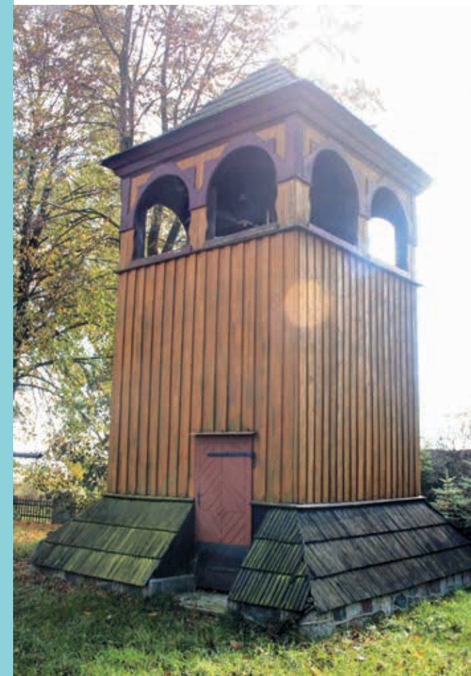
Dzwonnica przy kościele

Sędziny leżą w odległości 5 km od Dusznik, przy drodze z Buku do Pniew. Pierwsze zapiski o wsi pochodzą z XIV wieku. Jej nazwa oznacza prawdopodobnie, iż stanowiła ona uposażenie jakiegoś sędziego. W Sędzinach znajduje się pałac w stylu klasycystycznym z XVIII wieku, przebudowany w końcu XIX wieku. Wokół pałacu położony jest park z XIX wieku i pozostałości zabudowań folwarcznych z lat 1858-1900. W 1931 r. utworzono tu parafię, do której należały także miejscowości Sarbia i Wierzeja. Murowany kościół parafialny został zniszczony przez Niemców podczas II wojny światowej, na jego miejscu wybudowano najpierw drewniany kościółek. W latach 1976-1983 powstał nowy, duży kościół. Budowlę sfinansowali wierni parafii.