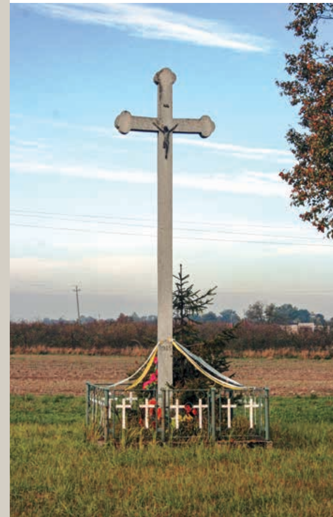
Chełminko – las

Einer großen Popularität erfreut sich das seit 1986 aktive Ensemble des Volksliedes „Radość“.