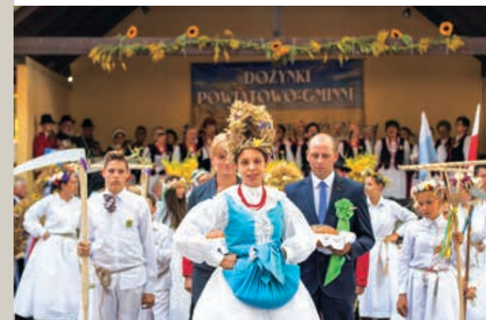
Zespół „Duszniczanka” “Duszniczanka” Folk Group Die Gruppe „Duszniczanka”