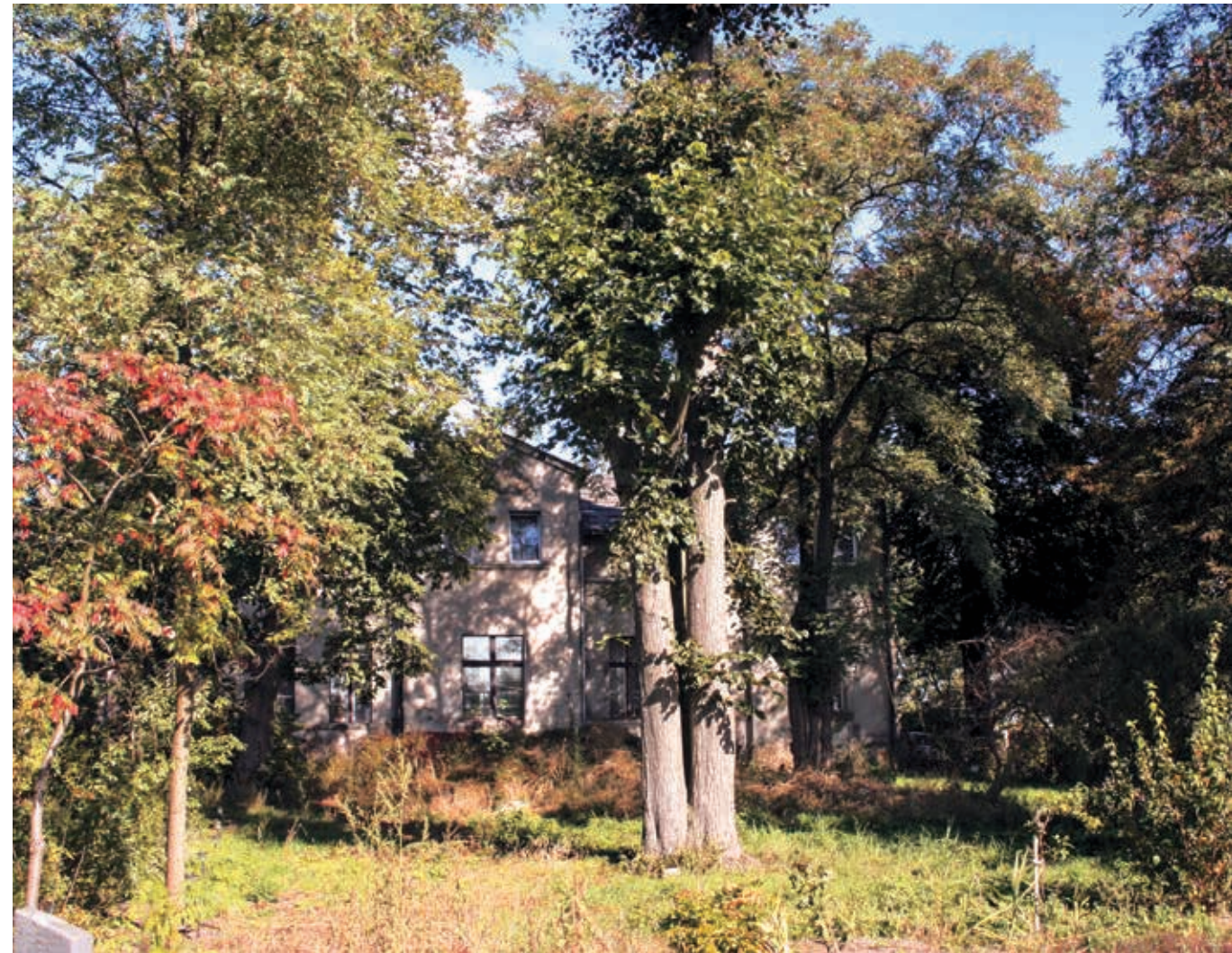
Pałac w Wilkowie

Wilkowo ist eine kleine, stille und ruhige Ortschaft, die südlich der Gemeinde Duszniki, an dem Weg aus Buk nach Grzebienisko situiert ist. Ihren Namen verdankt Wilkowo wahrscheinlich dem Wild (Wölfe), das in damaligen Zeiten den Urwald bewohnt haben. In den Quellen wurde Wilkowo zum ersten Mal in den Dokumenten von 1846 vermerkt. Aus früheren Zeiten blieb bis heute der Palast. Nach dem Krieg, über viele Jahre war er das Sitz der Schule, nach ihrer Liquidierung ging er in private Hände über.