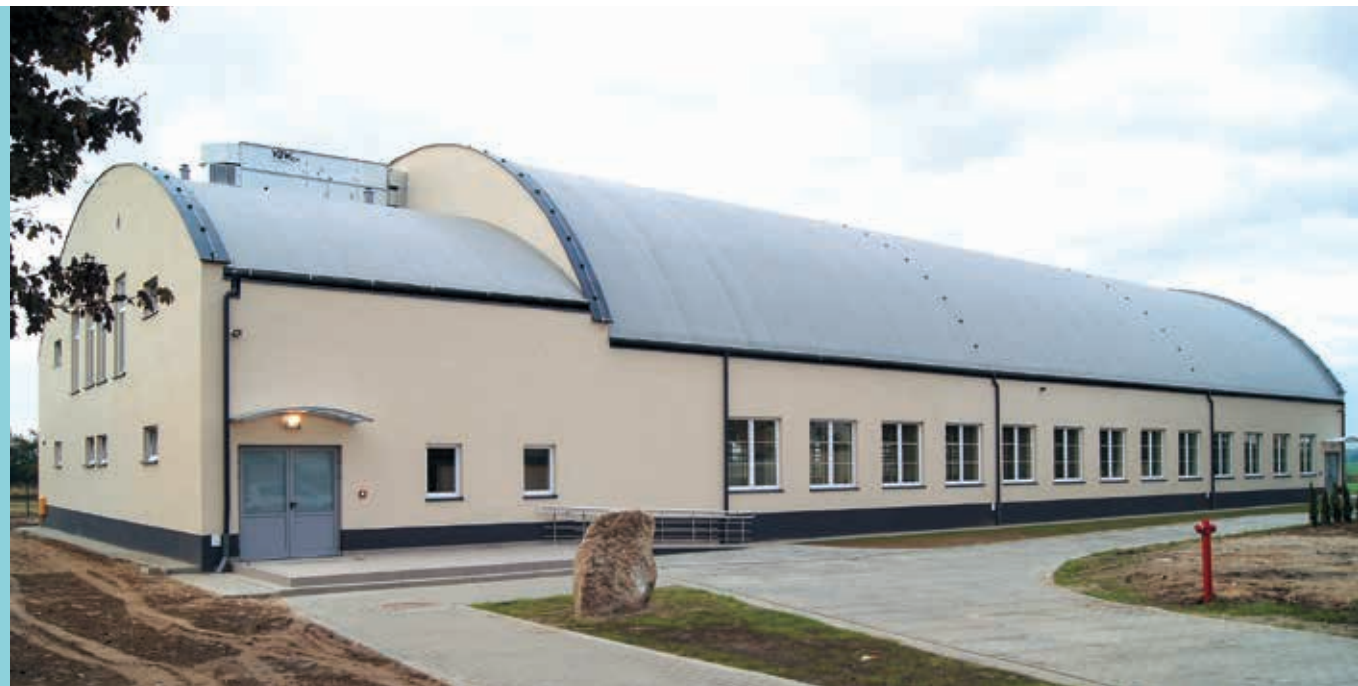
Kompleks sportowy w Dusznikach